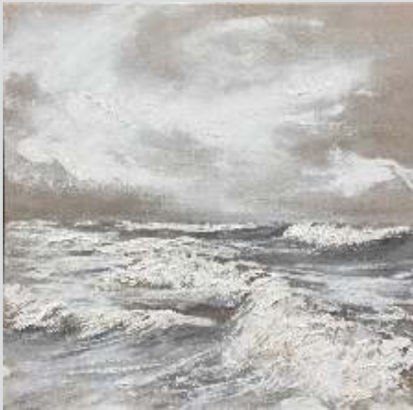
"NORTH SEA", 80 X 80 CM, OIL AND SAND ON CANVAS