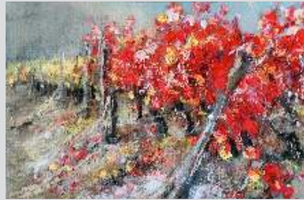
"ROSSO E GIALLO IN ARMONIA - BAROLO", 60 X 40 CM, OIL AND SOIL ON CANVAS