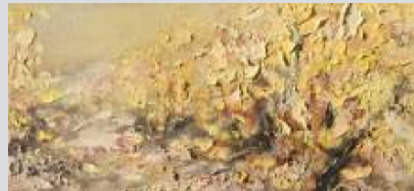
"CHAMPAGNE", 80 X 40 CM, OIL AND SOIL ON CANVAS