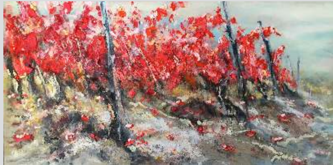
"ESPRIT DE LA VIGNE - BAROLO VINEYARD - MERIAME I", 60 X 80 CM, OIL AND SOIL ON CANVAS