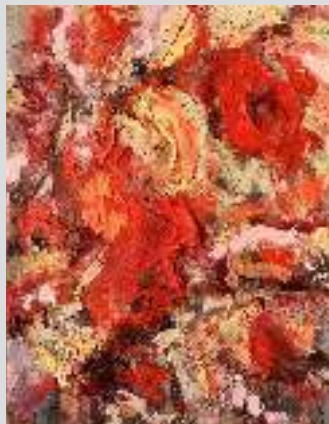
"FEUILLE ROUGE - BAROLO - NEBBIOLO", 30 X 40 CM, OIL AND SOIL ON CANVAS

U bent van harte uitgenodigd om samen met ons het glas (of een kop koffie natuurlijk) te heffen op de opening van deze verkoop expositie op 28 oktober tussen 15:00 en 18:30 uur. Mocht u verhinderd zijn dan is het werk ook na de opening nog te bezichtigen in Frederix Amsterdam.